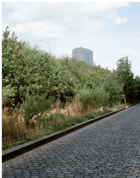
Nature , la Forêt linéaire , rue Chana Orloff, Paris, 18 e arr.

« (...) Ce simple changement de regard montre le potentiel d'entraînement des acteurs, des filières économiques et des innovations d'un tel territoire. Son ampleur, comme son positionnement au sein du Grand Paris, doit nous astreindre à porter une attention particulière et à considérer les évolutions de nos modes de vie et les grandes urgences contemporaines, climatiques, sanitaires et sociétales. »