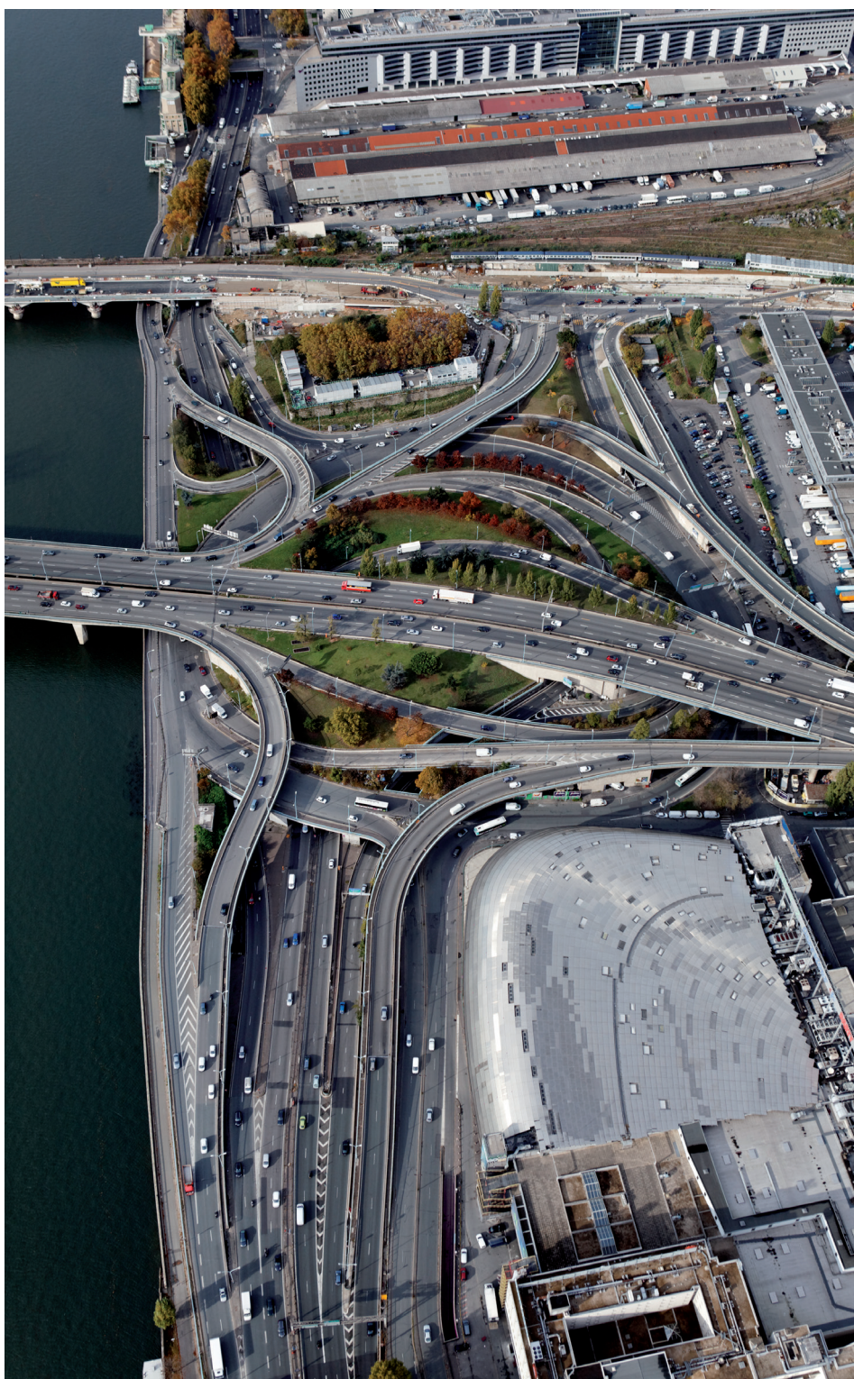
L'échangeur de la porte de Bercy , Charenton-le-Pont (94) et Paris, 12 e arr. L'un des échangeurs les plus complexes du Boulevard périphérique au cœur des projets des ZAC Bercy-Charenton et Charenton-Bercy. (Introduction historique d'Emmanuel Briolet Brève histoire des urbanismes de la ceinture parisienne. )