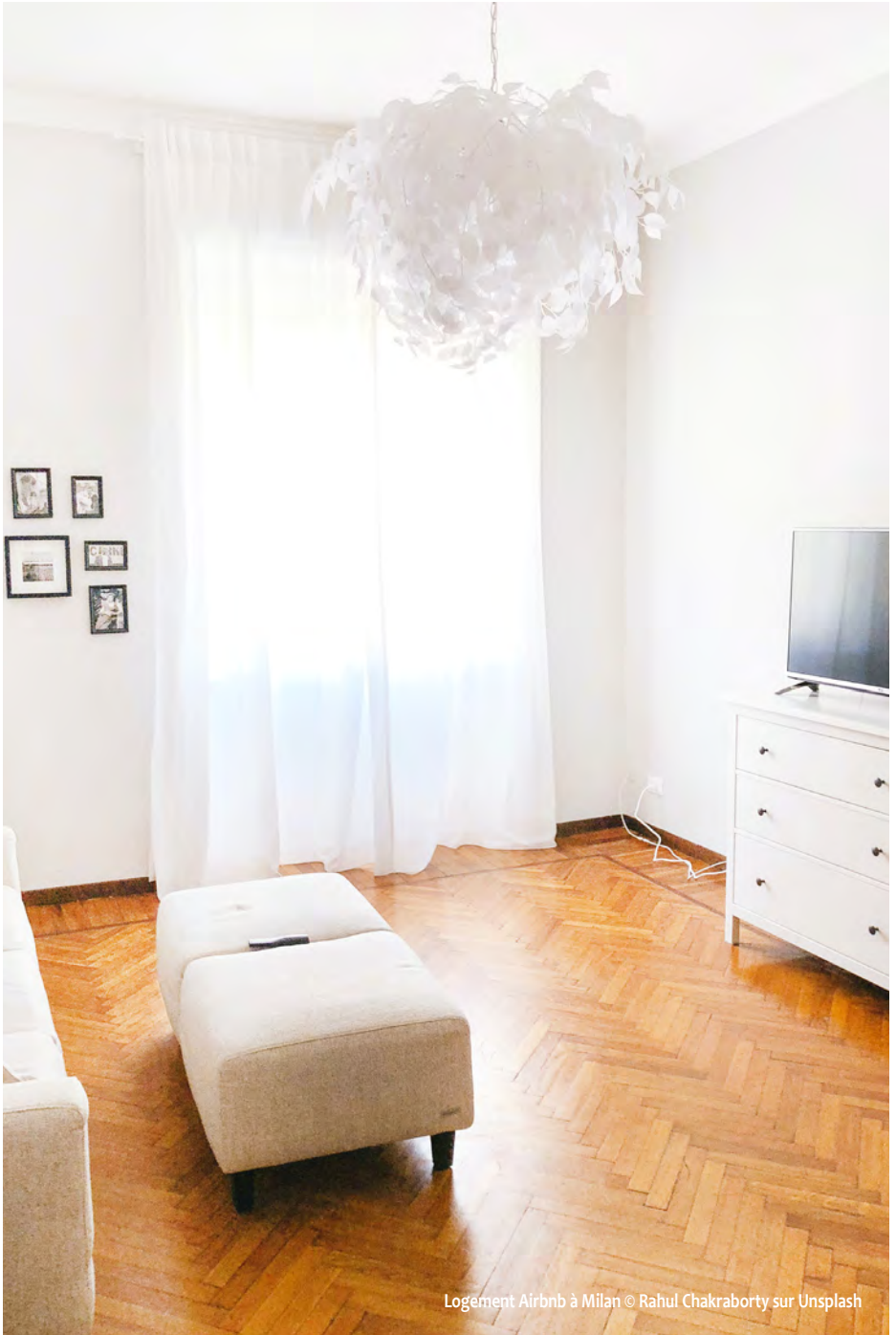
Logement Airbnb à Milan