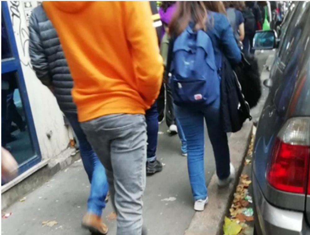
— Figure 1 : Rue Paul Vaillant-Couturier, Vitry sur Seine (RD155), septembre-octobre 2019 : un fort trafic piéton, ici de collégiens, dans des conditions inconfortables

Dans le domaine du transport, toute activité a besoin d'infrastructures en réseau adhérent à un territoire pour connecter des lieux. Développer un mode implique une vision d'ensemble de l'infrastructure qui le soutient et de l'espace qu'il faut lui réserver. C'est pourquoi, dans le cas de la marche, il est important d'identifier son infrastructure.