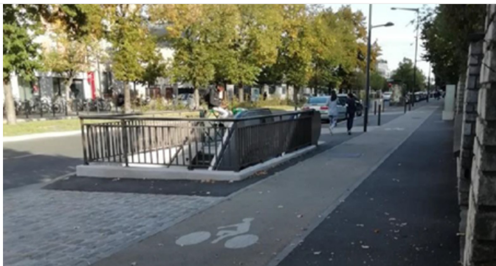
— Figure 2 : Avenue du Général Leclerc Maisons Alfort (RD19), octobre 2019 : un trottoir généreux, récemment aménagé, où la bande cyclable s'intercale entre la bouche du métro Maisons Alfort Stade et une bande piétonne obstruée un peu plus loin par un mobilier urbain

Le projet de conceptualiser l'infrastructure pédestre est né de la rencontre du Service Transport et Études Générales (STEG) du Conseil départemental du Val de Marne avec le Groupe Transversal de recherche « Mobilités Urbaines Pédestres[2] » (MUP) du Labex Futurs Urbains. Le STEG devait répondre à la demande des élus de transformer les routes départementales en « espaces publics à vivre »[3]. Cette collaboration a permis de faire du Val de Marne un cas d'étude sur les interdépendances systémiques qui conditionnent le développement de la marche, dans un contexte où le Grand Paris Express doit entraîner d'importants changements dans les mobilités, où des mutations sociales, économiques et foncières se produisent de manière accélérée, et où la voirie est particulièrement hétérogène.