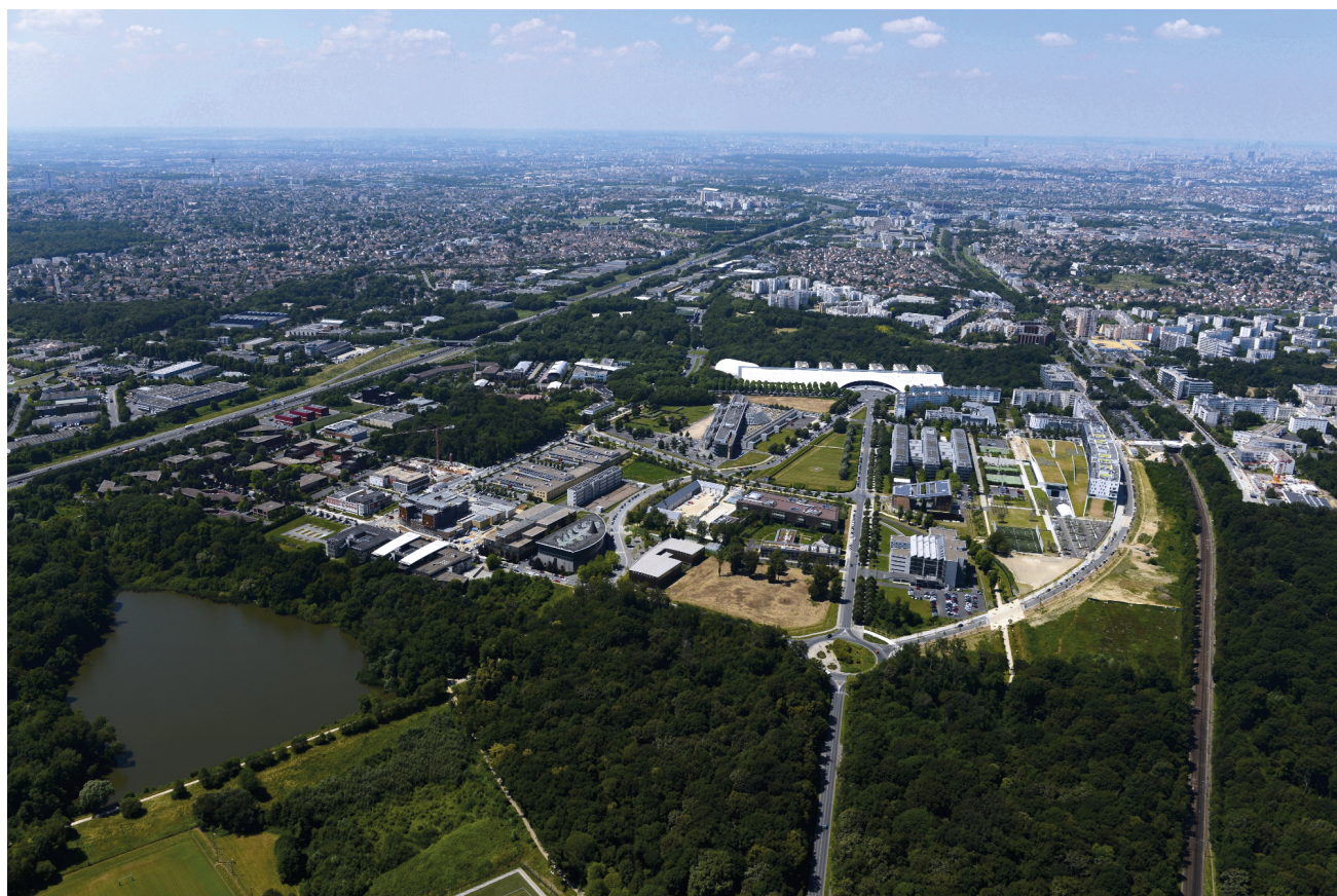
Cité Descartes.

La plupart des activités pédagogiques sont encadrées ou délivrées conjointement par plusieurs membres de l'équipe, de façon à constituer, avec les étudiant-es, un collectif de travail semblable à ceux qui exercent en conditions réelles.