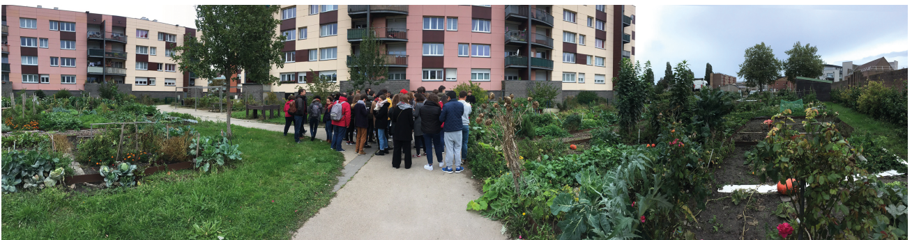
Voyage d'intégration de Master 1, 2019 © École d'Urbanisme de Paris.

Chaque année, l'EUP accueille près de 400 étudiant-es de niveau Master. Elle contribue autant au débat public qu'à l'animation des milieux professionnels par ses conférences, ses expositions et ses événements ouverts sur la société.