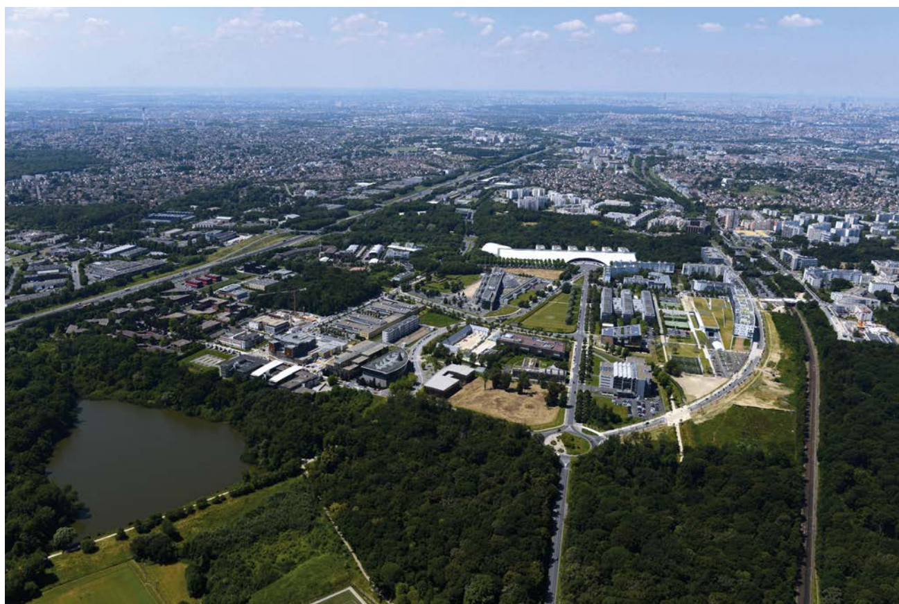
Cité Descartes.

La plupart des activités pédagogiques sont encadrées ou délivrées conjointement par plusieurs membres de l'équipe, de façon à constituer, avec les étudiant-es, un collectif de travail semblable à ceux qui exercent en conditions réelles.