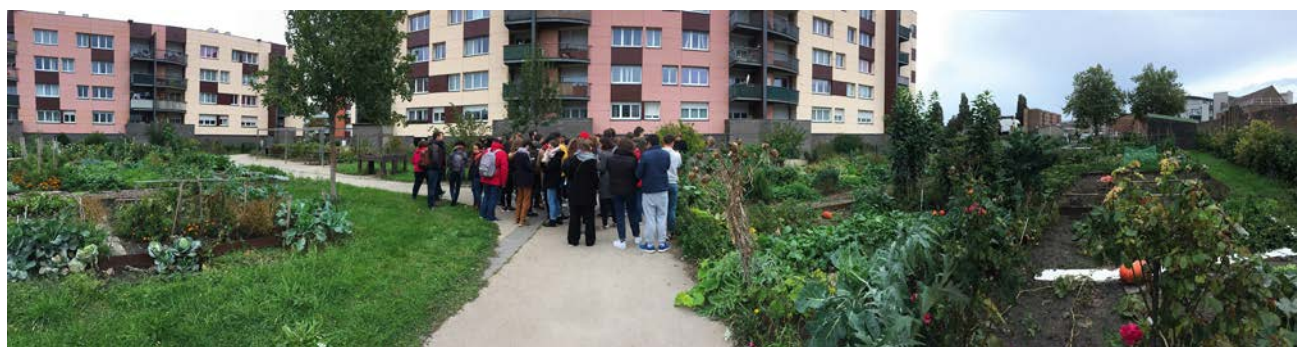
Voyage d'intégration de Master 1, 2019 © École d'Urbanisme de Paris.

Chaque année, l'EUP accueille près de 400 étudiant-es de niveau Master. Elle contribue autant au débat public qu'à l'animation des milieux professionnels par ses conférences, ses expositions et ses événements ouverts sur la société.