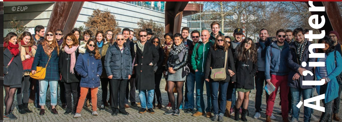
La promotion 2016-2017 du Master 2 Programmation, projet et management urbain lors de son voyage d'étude à Lisbonne

Des voyages d'études sont également organisés chaque année au sein de tous les parcours.