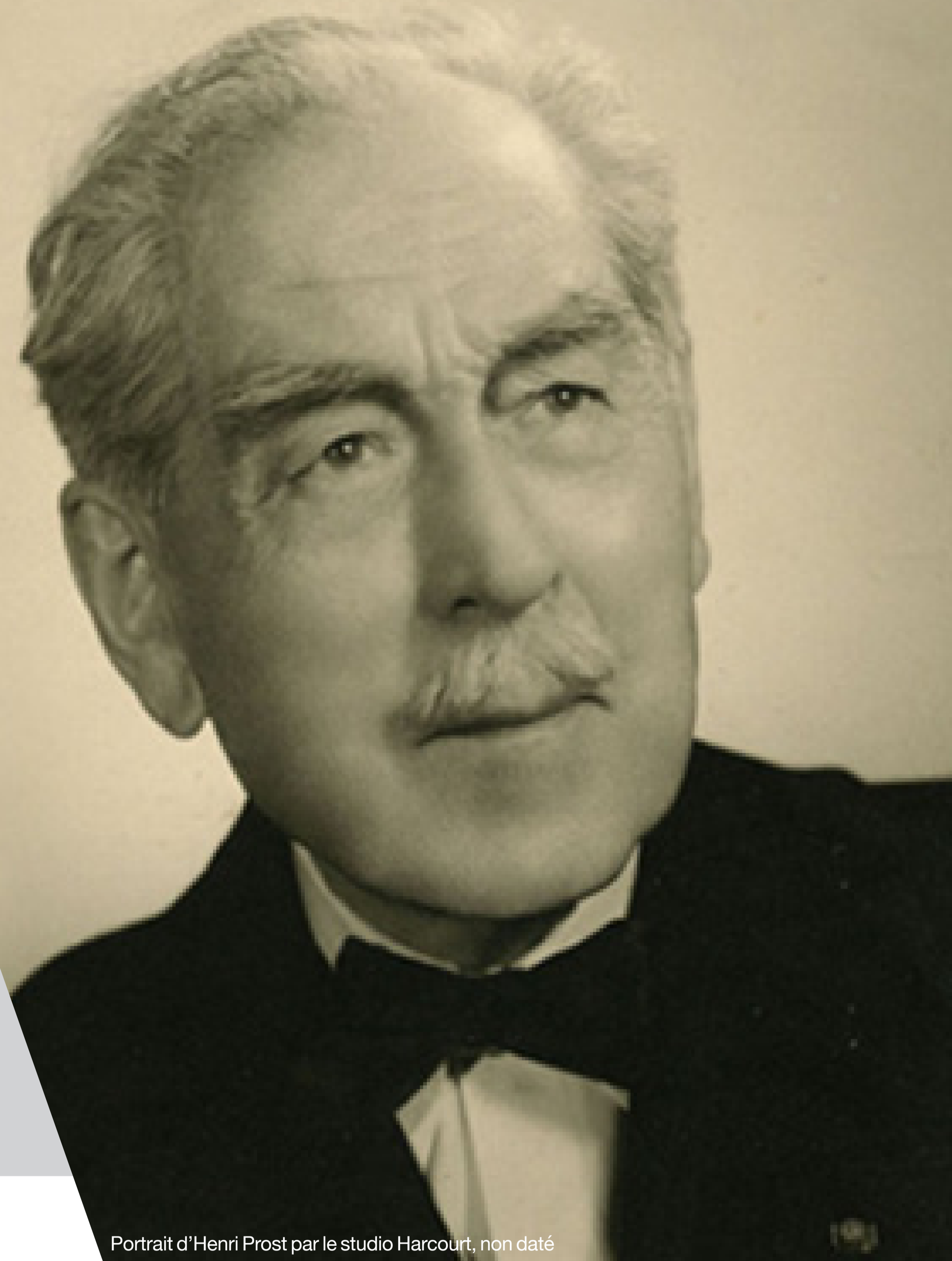
Portrait d'Henri Prost par le studio Harcourt, non daté

Né à Saint-Denis en 1874, Henri Prost fait des études à l'École spéciale d'architecture et dans la section architecture de l'École nationale supérieure des beaux-arts dont il sort Grand prix de Rome en 1902. Il participe aux débats du Musée social, fondation de réflexion au croisement des sphères scientifique, technique et politique, au sein de sa section d'Hygiène urbaine et rurale, creuset des premières politiques publiques en aménagement. Avec d'autres membres de la section, il fonde en 1911 la Société française des architectes-urbanistes qui deviendra Société française des urbanistes. En 1910, il remporte le concours international pour le plan d'extension d'Anvers. En 1913, à travers la section d'Hygiène urbaine et rurale du Musée social, il est appelé par Hubert Lyautey, représentant du gouvernement français dans le protectorat du Maroc pour former le service des Plans de ville. Dans ce cadre, il développe les plans de Casablanca, Rabat, Fès, Meknès, Marrakech, œuvre à la fois très en avance sur son temps, qui renouvelle l'urbanisme colonial et qu'il poursuit après être rentré en France en 1922. Il étend sa pratique à la planification régionale en étant chargé en 1923 du plan d'aménagement, d'embellissement et d'extension de la