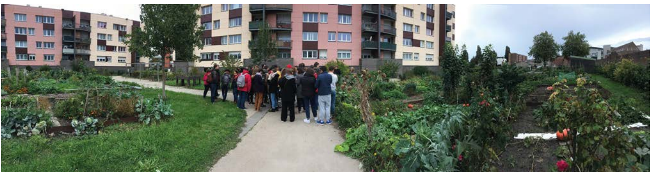
Voyage d'intégration de Master 1, 2019 © École d'Urbanisme de Paris.

Chaque année, l'EUP accueille près de 400 étudiant-es de niveau Master. Elle contribue autant au débat public qu'à l'animation des milieux professionnels par ses conférences, ses expositions et ses événements ouverts sur la société.