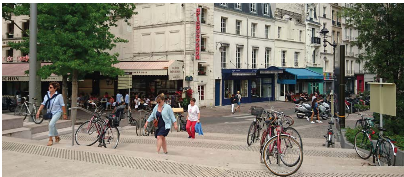
Paris, 2018.