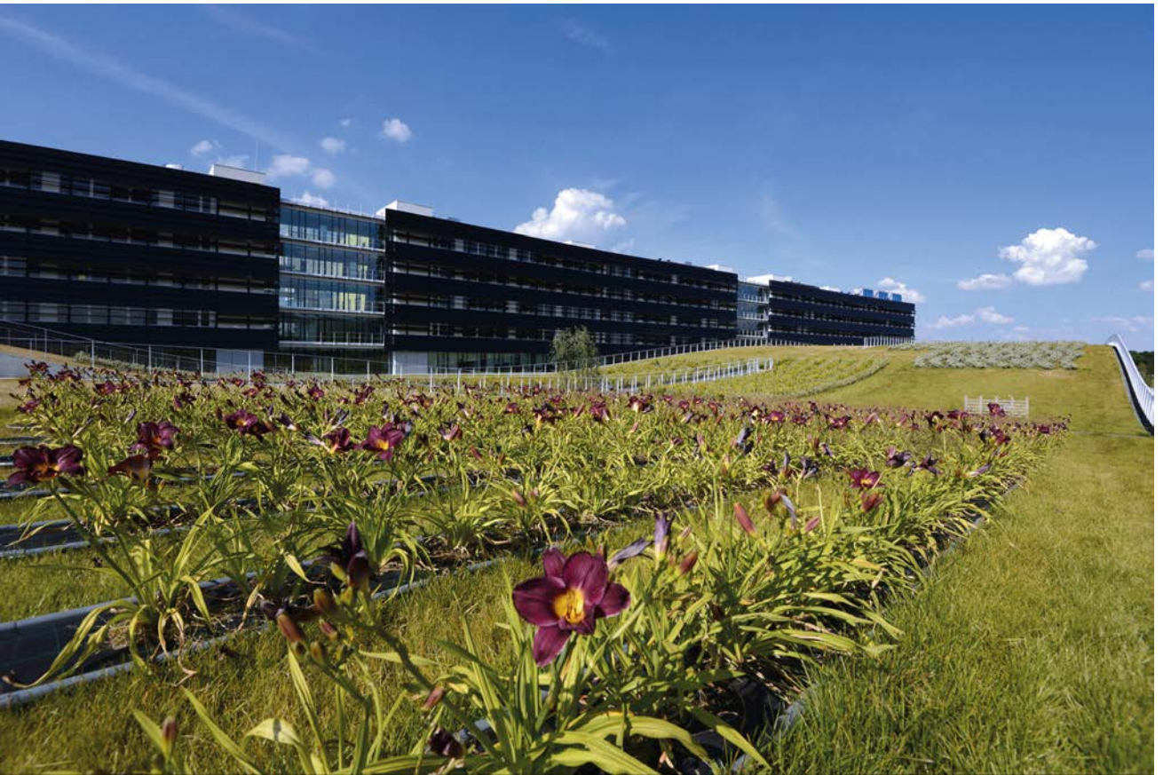
Cité Descartes. Bâtiment Bienvenue : architecte Jean-Philippe Pargade.