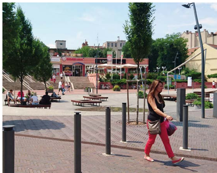
Ateliers, voyages d'études, balades urbaines. 2018.