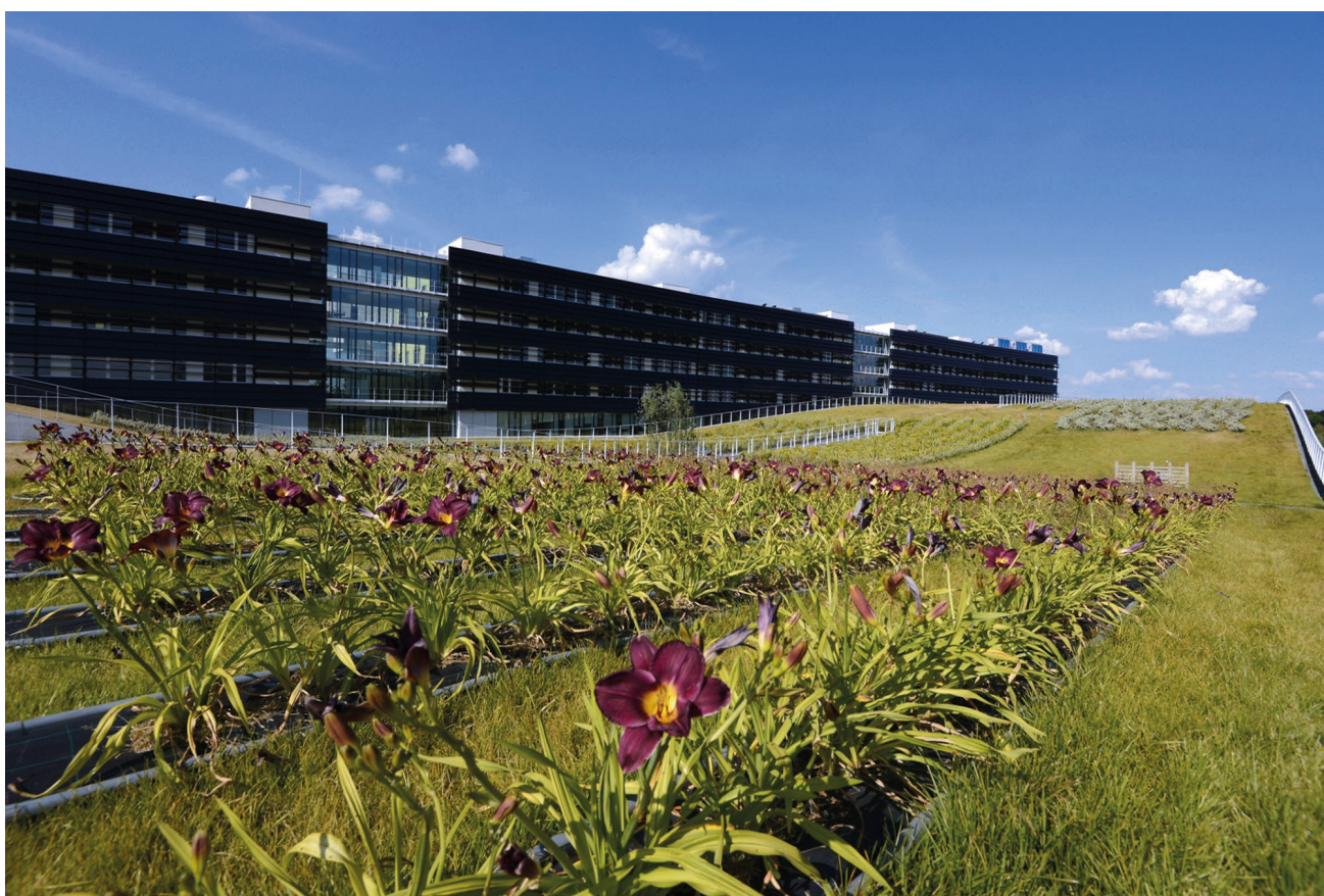
Cité Descartes.