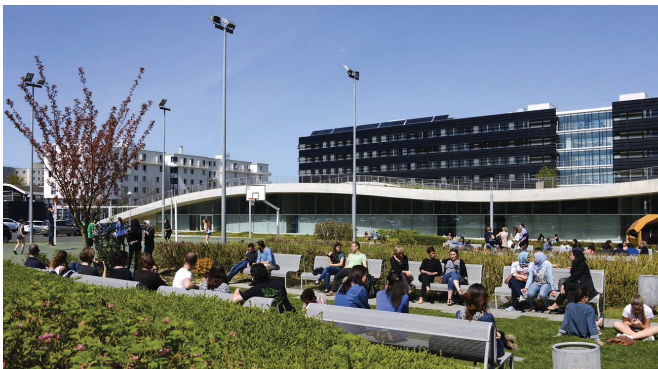
Cité Descartes, Bâtiment Bienvenüe. Architecte Jean-Philippe Pargade. Photo Éric Morency © Epamarne.