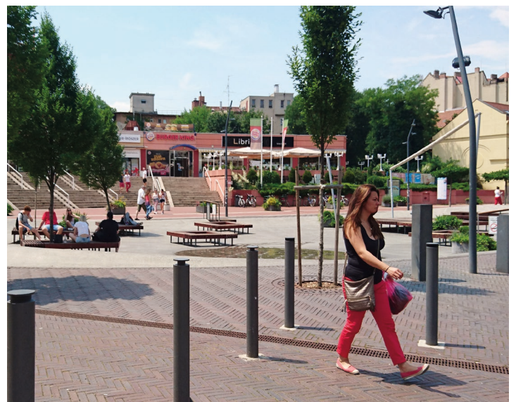
Ateliers, voyages d'études, balades urbaines. 2018.