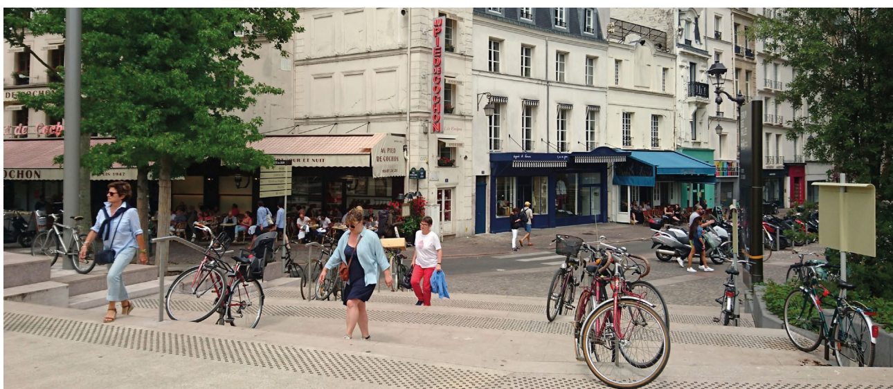
Paris, 2018.