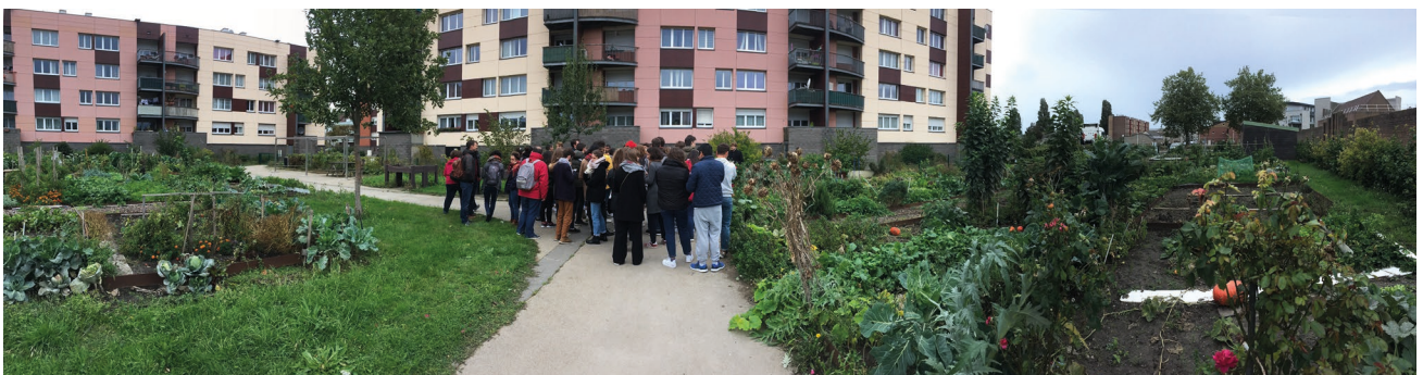
Voyage d'intégration de Master 1, 2019 © École d'Urbanisme de Paris.

Chaque année, l'EUP accueille près de 400 étudiant-es de niveau Master. Elle contribue autant au débat public qu'à l'animation des milieux professionnels par ses conférences, ses expositions et ses événements ouverts sur la société.