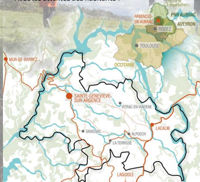
Argences-en-Aubrac : commune nouvelle issue de la fusion de 6 communes - contextes