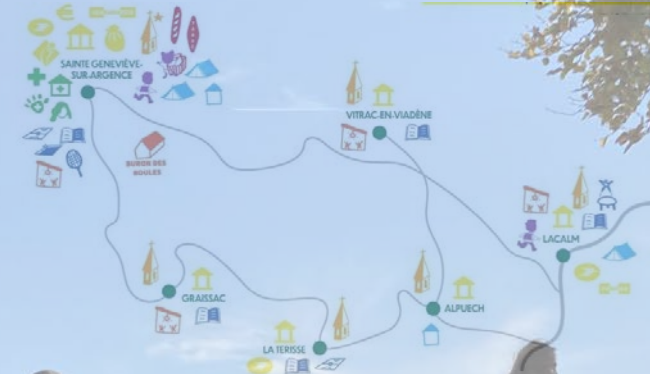
Concentrations des services selon les bourgs

Les nombreuses ressources naturelles, telles que le paysage du plateau de l'Aubrac, l'eau, le bois, et sources d'énergie verte produites sur le territoire, participent fortement à l'identité d'Argences-en-Aubrac. D'autres ressources sont exploitées pour développer des services et activités, dynamisant le territoire.