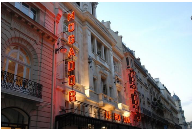
Théâtre Mogador.

Le potentiel nocturne et culturel. Enfin, le quartier dispose d'un fort potentiel exploitable. Si son image commune est celle de son centre très commercial, impulsé par les grands magasins, ainsi que la cité financière, en périphérie des grands boulevards réside un réel potentiel.