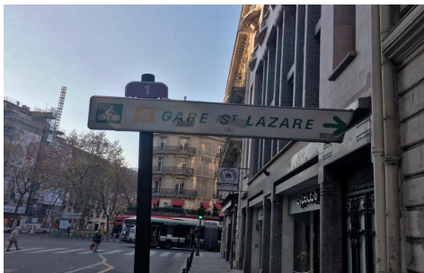
Itinéraire cyclable.

Les carences de la signalétique. Les commanditaires ont insisté sur la signalétique concernant le report modal des touristes, d'un transport touristique classique (cars) à un transport plus 'local' et responsable. Notre diagnostic de la signalétique a consisté à évaluer l'efficacité de la signalétique à destination des piétons et des cyclistes. Ce type de signalétique a une emprise touristique et a une vocation de rabattement, elles guident les visiteurs vers les différentes polarités du quartier. Mais elle n'est pas entièrement fonctionnelle et pertinente sur tout le périmètre :