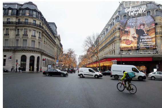
Galeries Lafayette.

Le quartier d'affaires. C'est la partie ouest de ce que les acteurs de l'immobilier appellent "le Quartier Central des affaires de Paris". Plus de 70% des emplois du quartier sont des emplois de bureau et le 9ème arrondissement compte près de 80 000 emplois de bureau. C'est un quartier d'affaires récent et "à la mode" qui se développe grâce à la rénovation d'immeubles de logement en immeubles de bureaux depuis les années 1990. Ce processus de rénovation est toujours en cours et tend à s'étendre vers l'est du quartier et du périmètre.