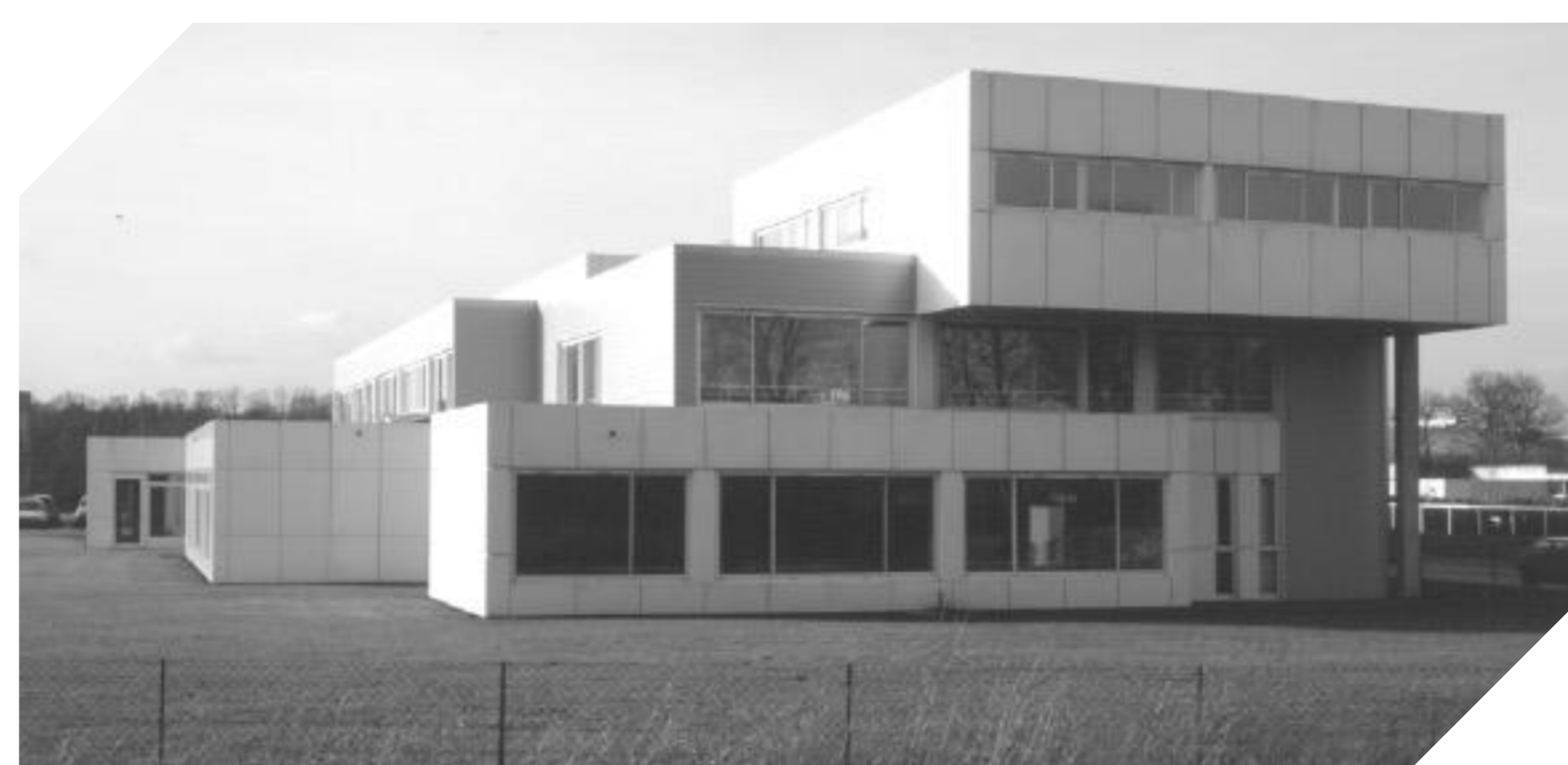
Le bâtiment spécifique au sein de la Cité Descartes à Marne-la-Vallée qui accueille l'Institut français d'urbanisme de 1991 à 2014.

En 1987, l'IFU déménage dans la ville nouvelle de Marne-la-Vallée. C'est en 1991 qu'il intègre enfin le bâtiment construit spécialement pour son usage sur le site de la Cité Descartes et qu'il occupera pendant près de 25 ans. Dès le début des années quatre-vingt-dix, alors qu'est créée l'Université de Marne-la-Vallée, il est prévu que ce site accueille un pôle de formation et de recherche sur la ville : après l'IFU, s'y implantent l'École nationale des ponts et chaussées, l'École d'architecture de la ville et des territoires mais aussi des institutions de recherche avec la création, plus tard, de l'Institut français des sciences et technologies des transports, de l'aménagement et des réseaux (IFSTTAR). L'IFU qui a stabilisé ses effectifs et ses équipes pédagogiques dès la fin des années quatre-vingt, est confronté au milieu des années quatre-vingt-dix à des interrogations moins sur sa pédagogie que sur son projet et son identité entre filiation avec l'héritage « progressiste et ouvert » de l'Université Paris VIII et engagement dans une nouvelle perspective au moment où les mondes de l'urbanisme étaient entrés dans de profonds changements. Ce difficile débat aboutit au choix de rejoindre l'Université de Marne-La-Vallée en 2009 et de se rapprocher de l'Institut d'urbanisme de Paris. Ici aussi, la réforme LMD abouti à la création d'un Master unique.