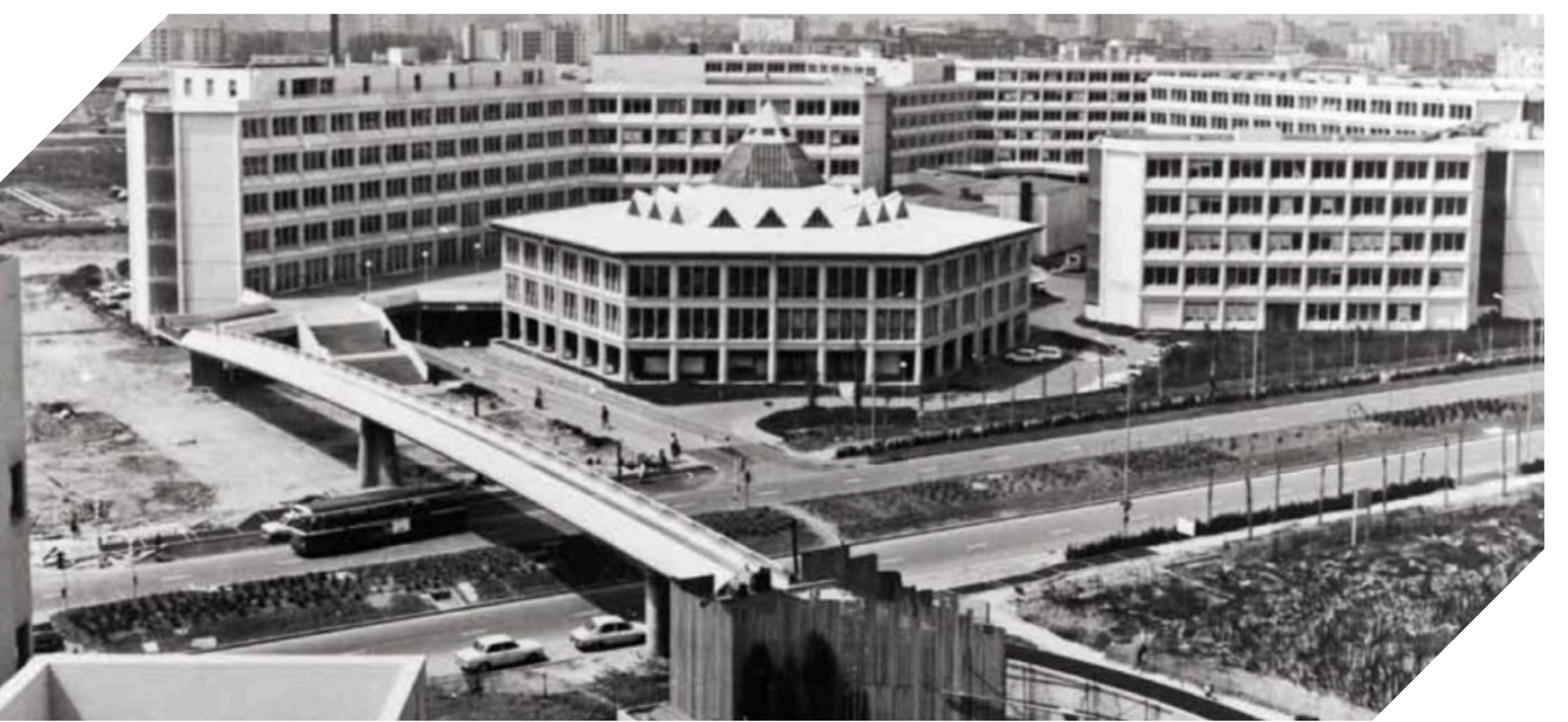
Le Centre multidisciplinaire de Créteil où est installé l'Institut d'urbanisme de Paris de 1972 à 2000.