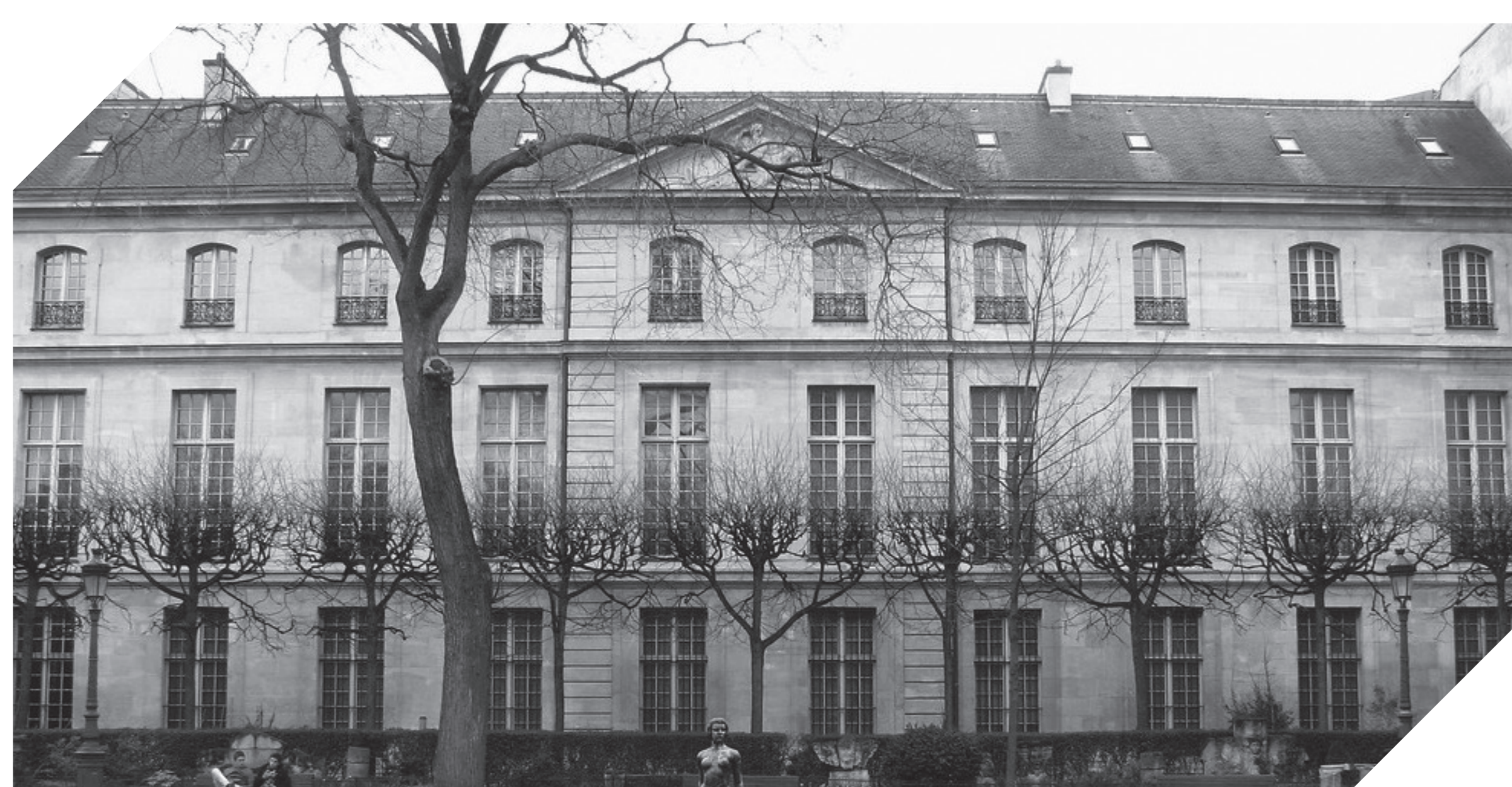
Hôtel Le Peletier de Saint-Fargeau, 28 rue de Sévigné à Paris, siège de l'École des hautes études urbaines de 1919 à 1924.