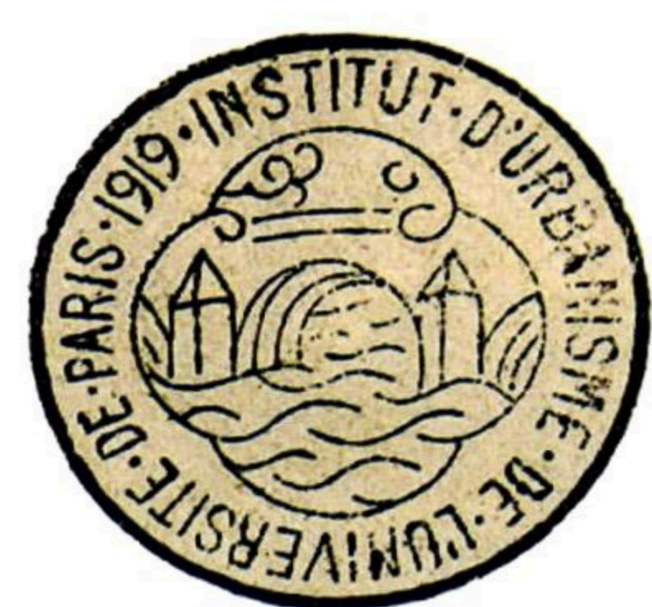
Tampon de l'Institut d'urbanisme de l'Université de Paris reprenant le Pont Neuf comme symbole.

En 1924, l'École intègre l'université et le bâtiment de la Sorbonne en devenant l'Institut d'urbanisme de l'Université de Paris (IUUP) rattaché à la faculté de droit. Son statut confère cependant à l'Institut une certaine autonomie administrative et pédagogique et un diplôme spécifique, le DIUUP. En 1933, il rejoint le spectaculaire bâtiment construit pour abriter l'Institut d'art et d'archéologie, rue Michelet dans le VI ème arrondissement, qui restera son adresse durant plus de trente ans. Le prestige international de l'Institut est grand: les longues listes d'étudiants étrangers des années vingt et trente en témoignent. A partir des années quarante, l'enseignement se divise entre «enseignements généraux», assurés par des universitaires, et «enseignements techniques», assurés par des architectes, ingénieurs, géomètres. L'ENAM tend, elle, à se couper de plus en plus d'un Institut qui évolue peut-être moins vite que le contexte institutionnel et socio-économique dans